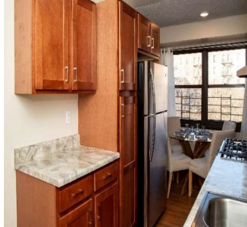
Cải tiến căn hộ ở Twin Parks West