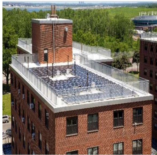
Sửa chữa mái nhà và hệ thống tấm năng lượng mặt trời ở Ocean Bay (Bayside)