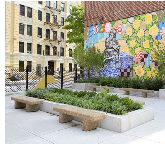
Cải tiến chung ở Betances West