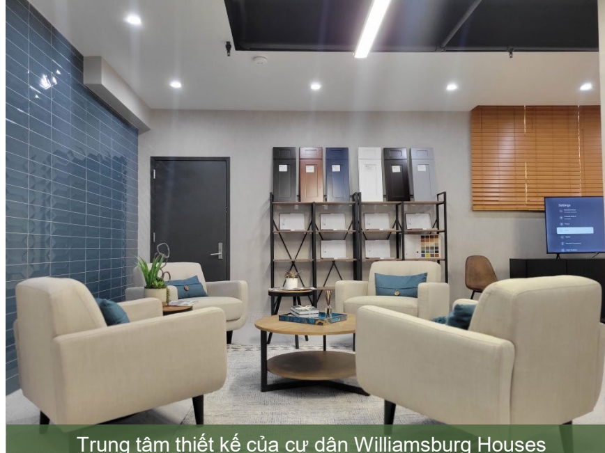
Trung tâm thiết kế của cư dân Williamsburg Houses

Các chương trình sẽ được hoàn thành với sự hợp tác của cư dân