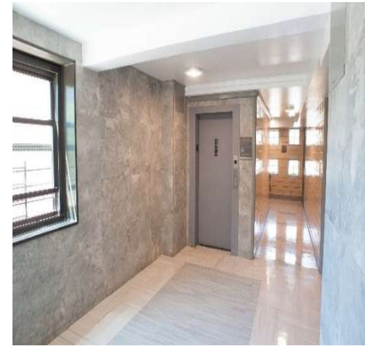
Cải tiến lối vào tòa nhà ở Ocean Bay (Bayside)